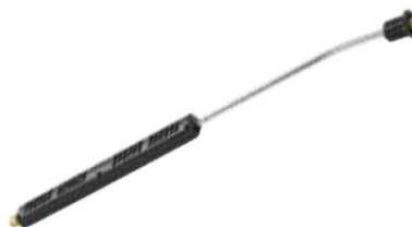
Lance profesionala cu jet fix.