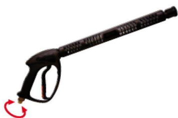
Pistol profesional cu racord pivotant.