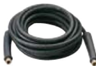
Furtun de inalta presiune de 10 m.